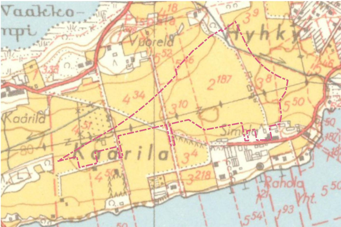
Kartta 3. Hyhkylnlaakson asemakaavan muutosalue vuoden 1953 peruskartalla.