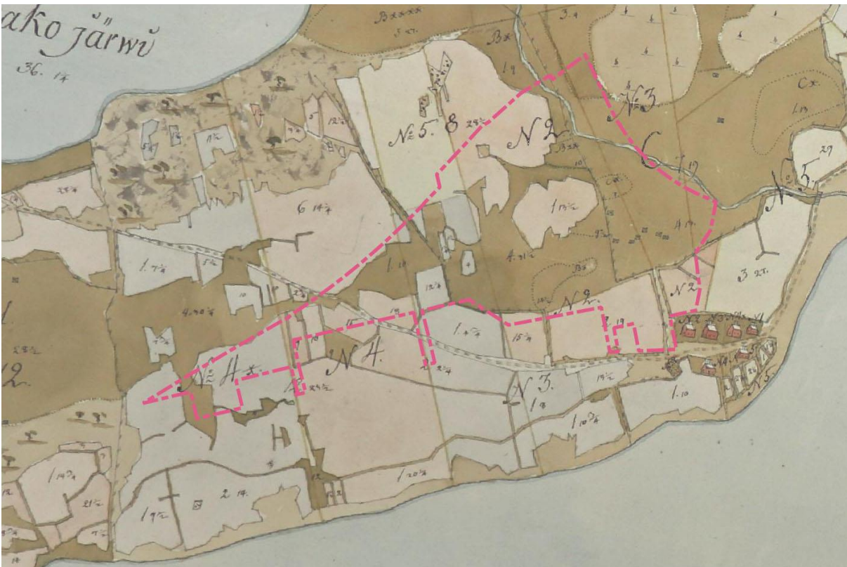
Kartta 2. Hyhkynlaakson asemakaavan muutosalue isojaon kartalla (1767 - 68).