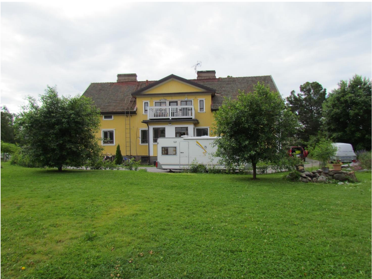
Kuva 1. Simolan talo 26.6.2019.

Kohde sijaitsee Pyhäjärven pohjoisrannalla, rantaa pitkin kulkevan itä-länsi suuntaisen harjanteen korkeimmassa kohdassa, sen itäpäässä, Hyhkynlahden luoteisrannalla Simolankadun varrella. Suurin osa alkuperäistä tonttimaata on nykyään rivitalojen (Simolankadun eteläpuolella) tai Pispän palvelukeskuksen alla. Parhaiten säilynyt muinaisjäätännöksen osa on pääosin Simolan talon tontilla ja pihapiirissä kadun pohjoispuolella (Simolankatu 6), palvelukeskuksen länsipuolella. Harjanteen pohjoispuolella on peltoalue, jolla on maisemallinen yhteys kylätonttiin.