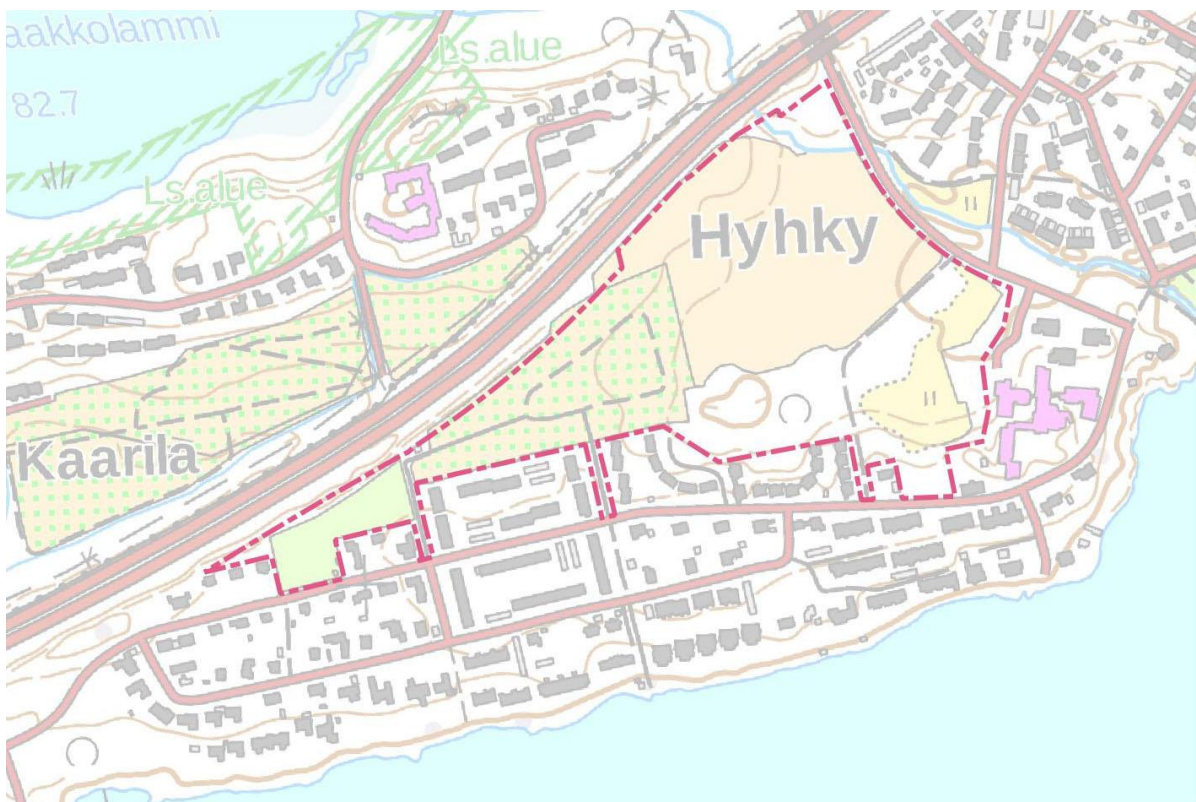
Kartta 4. Hyhkylnlaakson asemakaavan muutosalue nykykartalla.