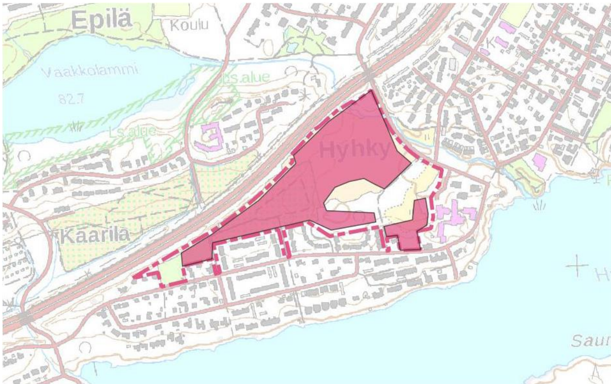
Kartta 5. Inventointialue ja maastossa tarkastetut alueet, jotka on merkitty karttaan punaisella. MK 1 : 10 000.