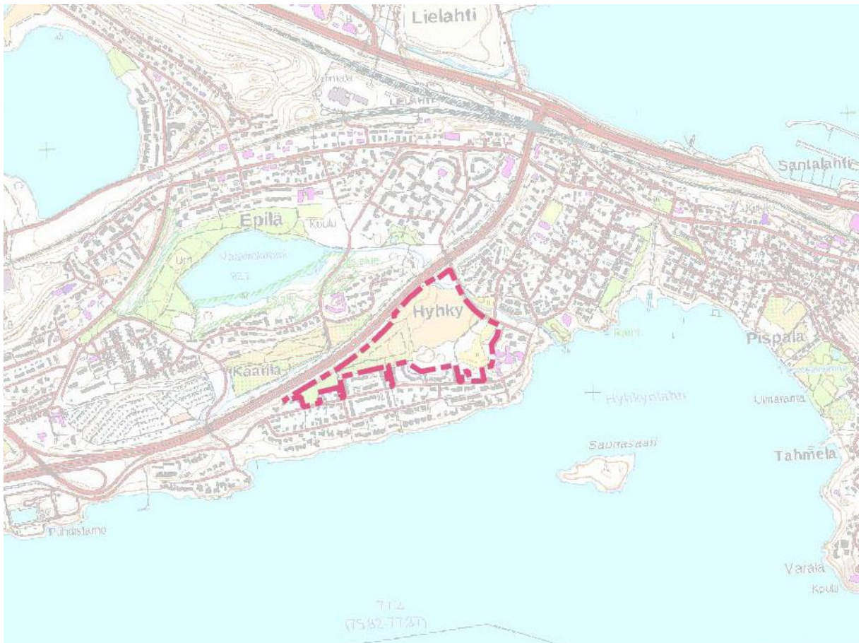
Kartta 1. Inventointialueen sijainti. MK 1 : 20 000.