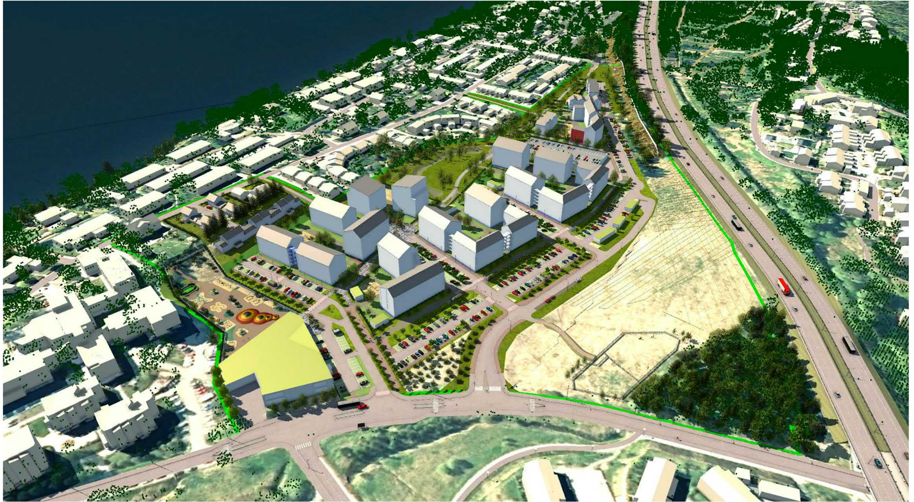
Kaarila, Hyhkynlaakson uusi asuinalue, kaava nro 8391 Havainnekuva 3: Viistosti koillisesta 26.10.2020