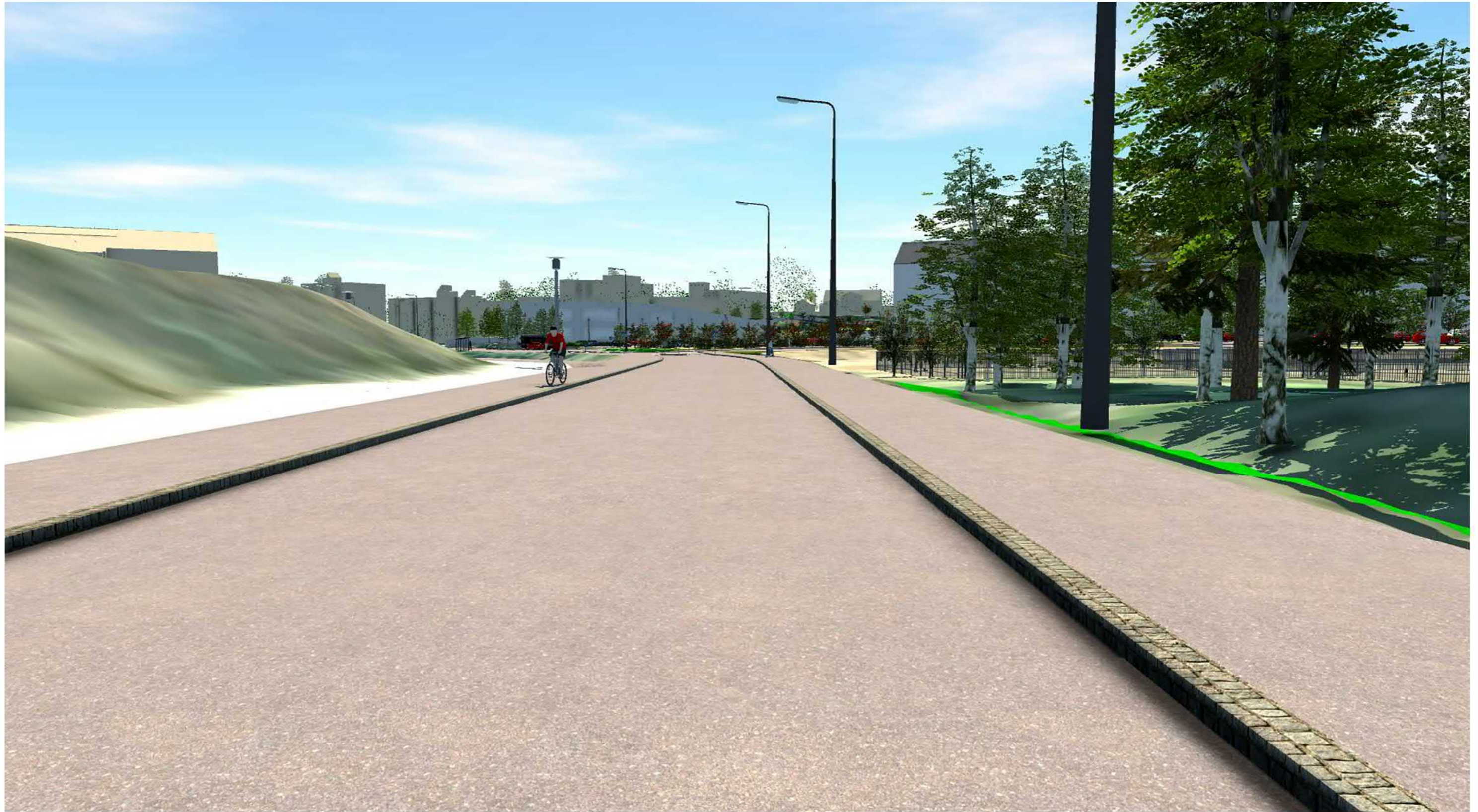
Kaarila, Hyhkynlaakson uusi asuinalue, kaava nro 8391 Havainnekuva 5: Näkymä Mattilankatua etelään kohti Simolan taloa