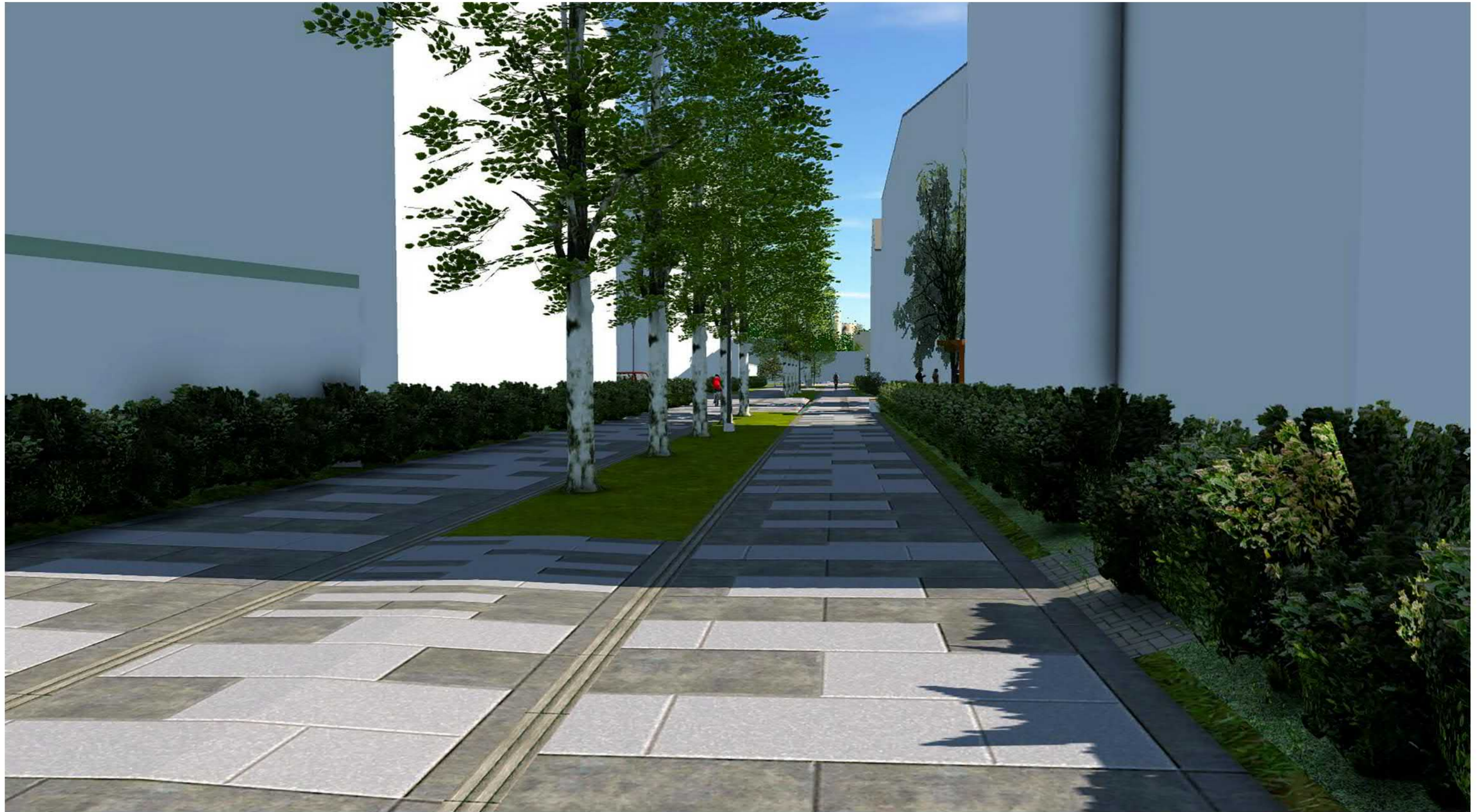
Kaarila, Hyhkynlaakson uusi asuinalue, kaava nro 8391 Havainnekuva 7: Näkymä alueen keskusaukiolta kohti Pispalaa