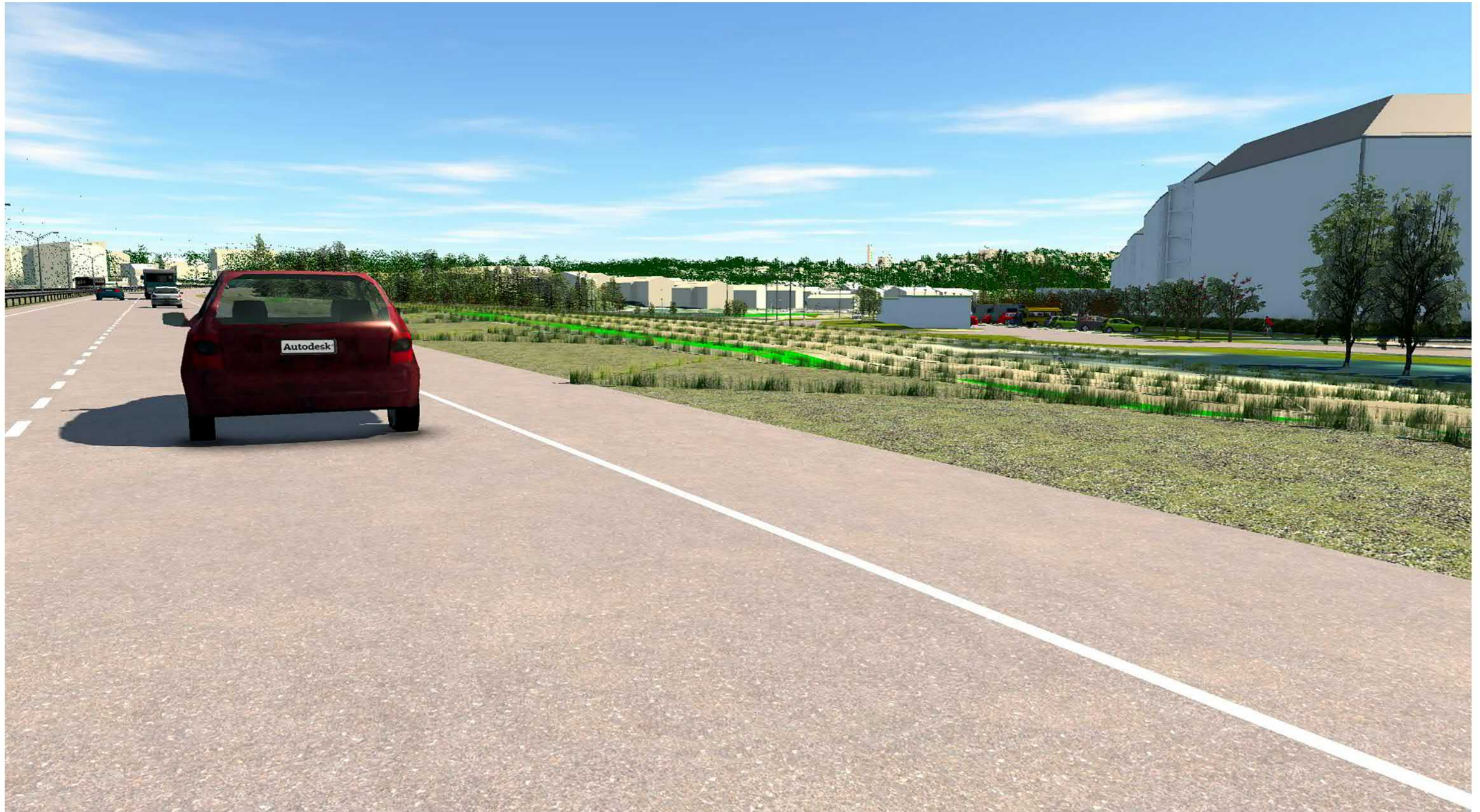
Kaarila, Hyhkynlaakson uusi asuinalue, kaava nro 8391 Havainnekuva 6: Näkymä moottoritietä maisemaniityn ja paikoitusalueen yli kohti Pispalaa