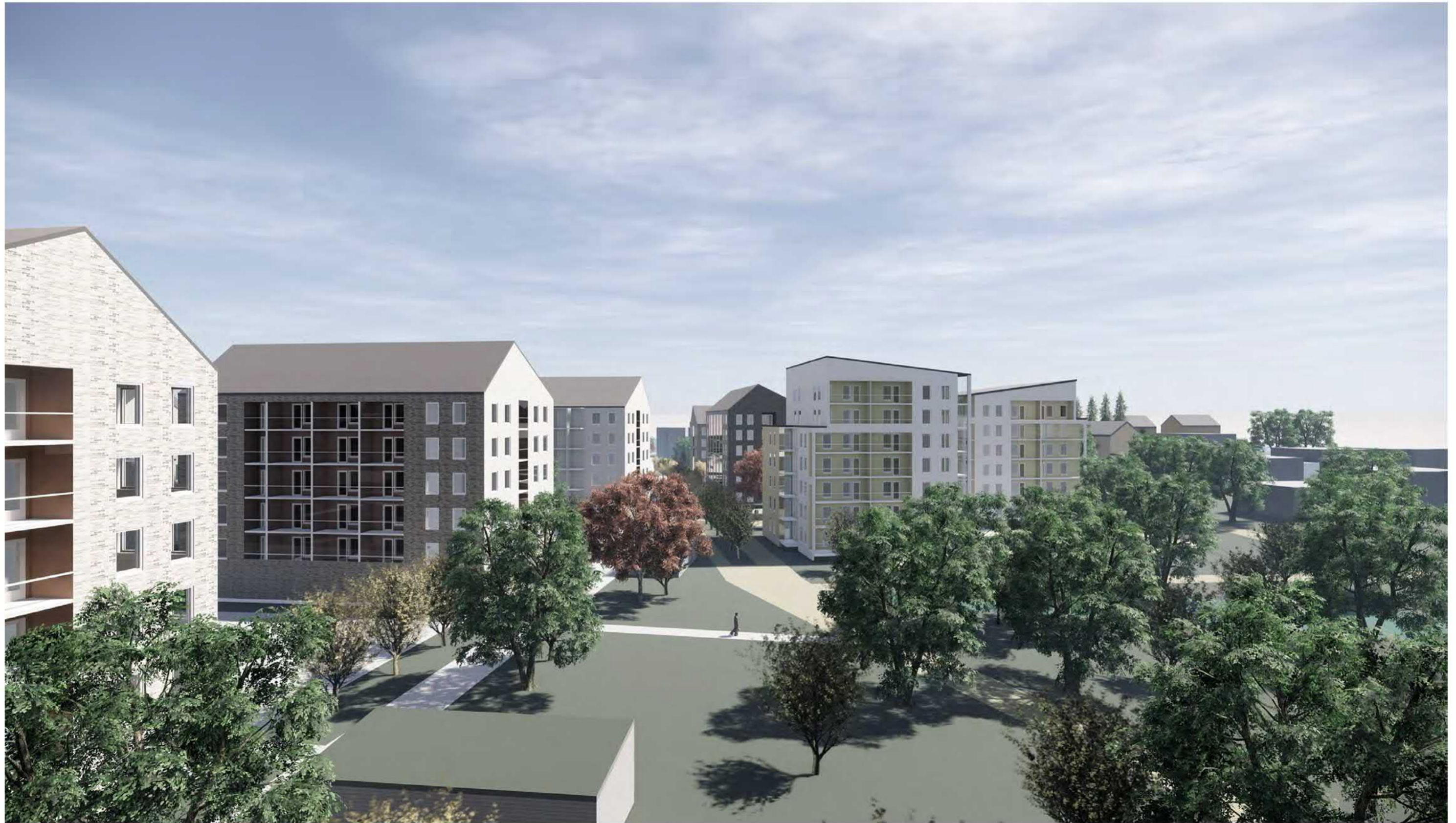
Kaarila, Hyhkynlaakson uusi asuinalue, kaava nro 8391 Havainnekuva 10: Näkymä tontin 1179-4 talon E parvekkeelta kohti itää