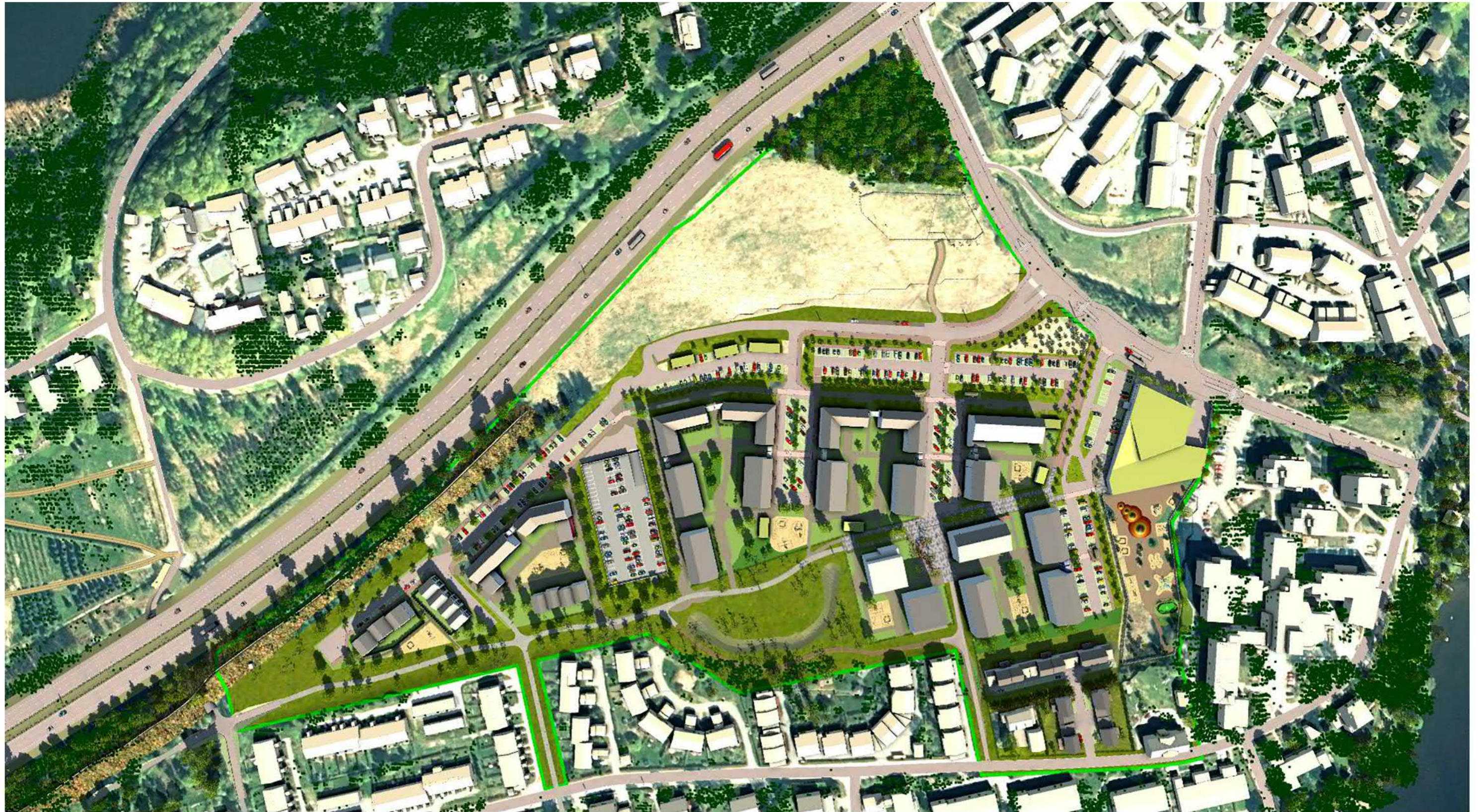
Kaarila, Hyhkyntlaakson uusi asuinalue, kaava nro 8391 Havainnekuva 2. 26.10.2020