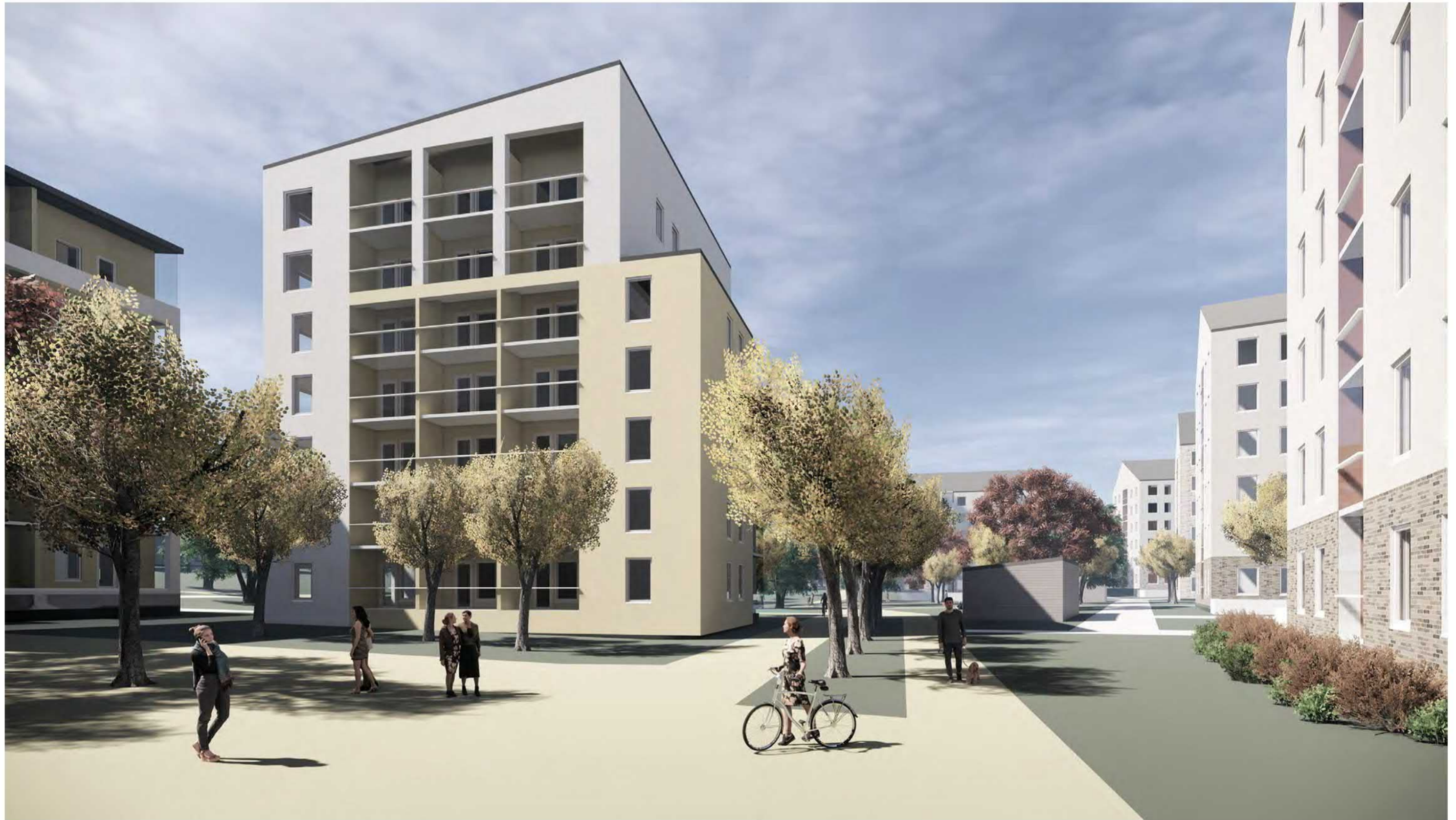
Kaarila, Hyhkyntlaakson uusi asuinalue, kaava nro 8391 Havainnekuva 9: Näkymä keskusaukiolta länteen 26.10.2020