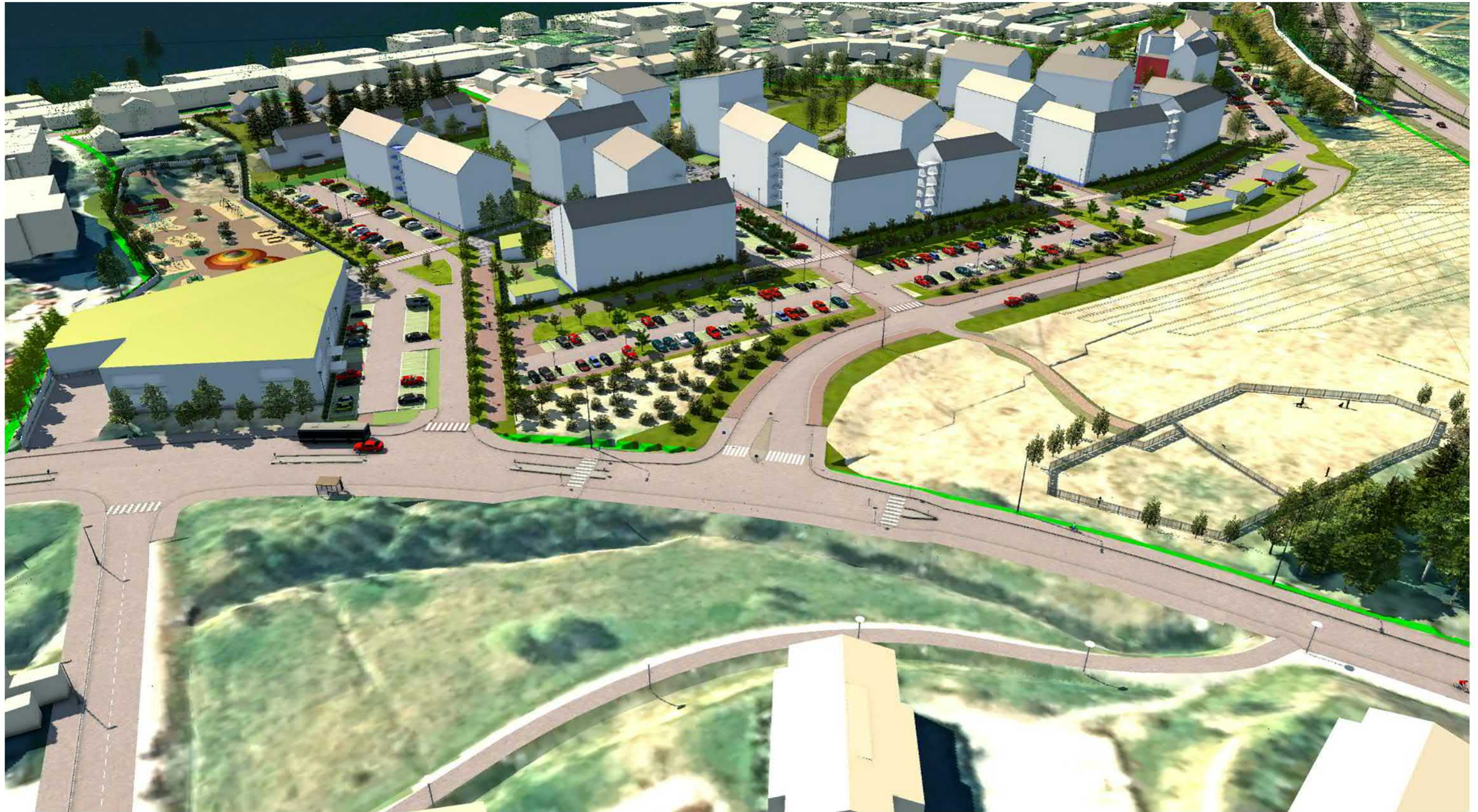
Kaarila, Hyhkynlaakson uusi asuinalue, kaava nro 8391 Havainnekuva 4: Vasemmalla päiväkotiki ja oikealla koirapuisto