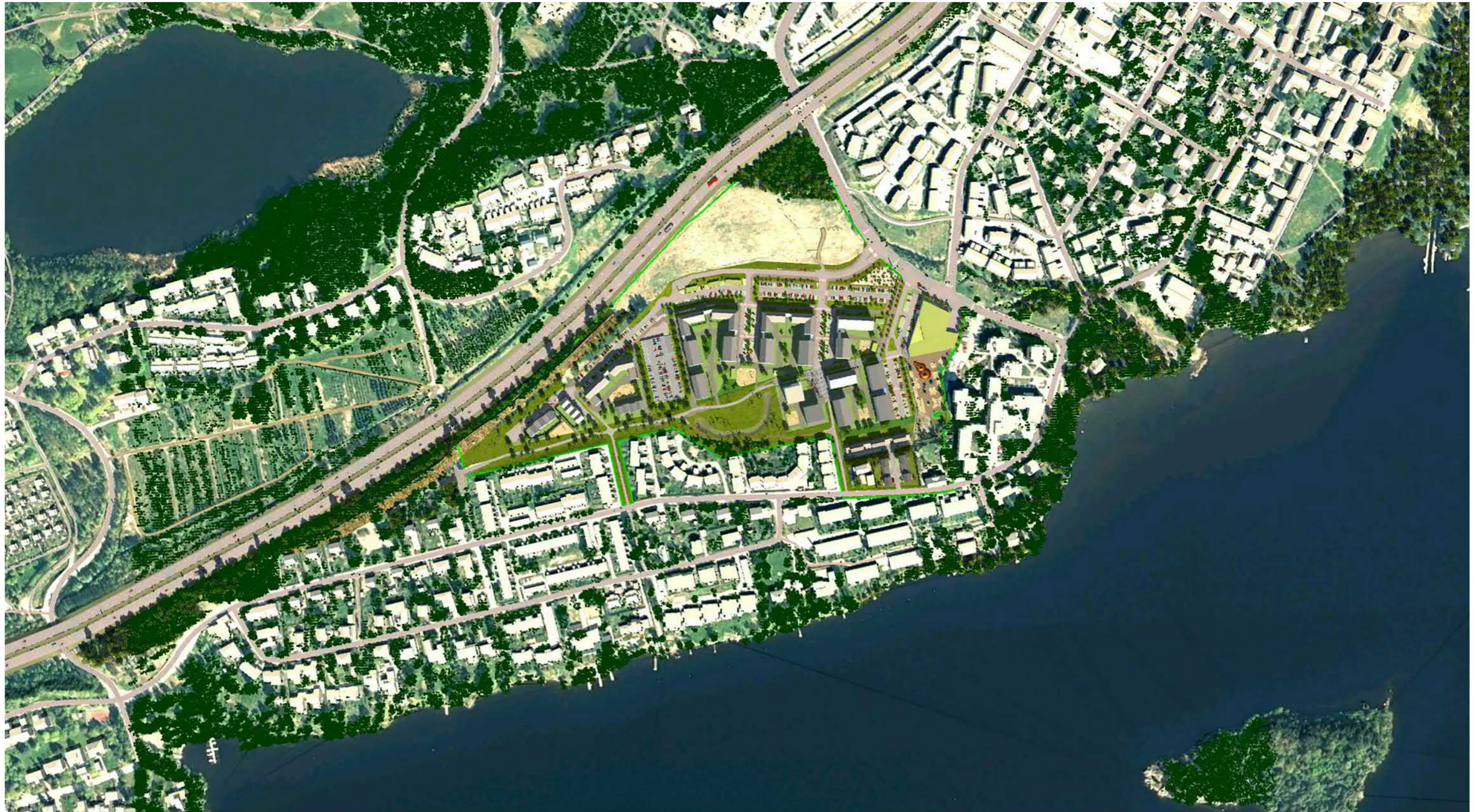
Kaarila, Hyhkynlaakson uusi asuinalue, kaava nro 8391 Havainnekuva 1. 26.10.2020