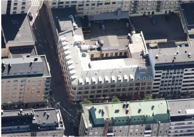
Ilmakuva © Blom 2018. Kopiointi kielletty.