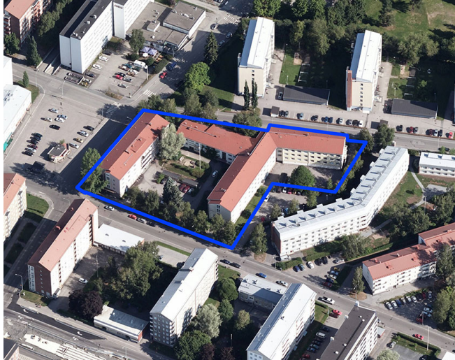
Ilmakuva etelästä © Blom 2018. Kopiointi kielletty.