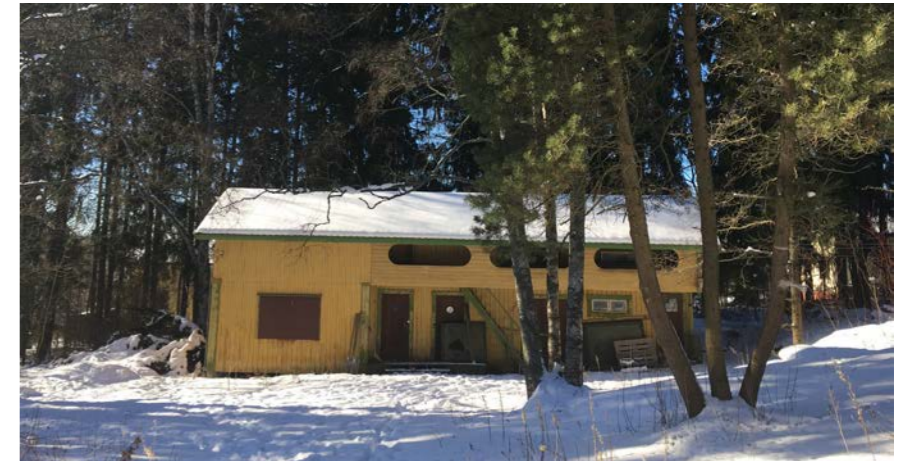
6: OLEMASSA OLEVA AITTA