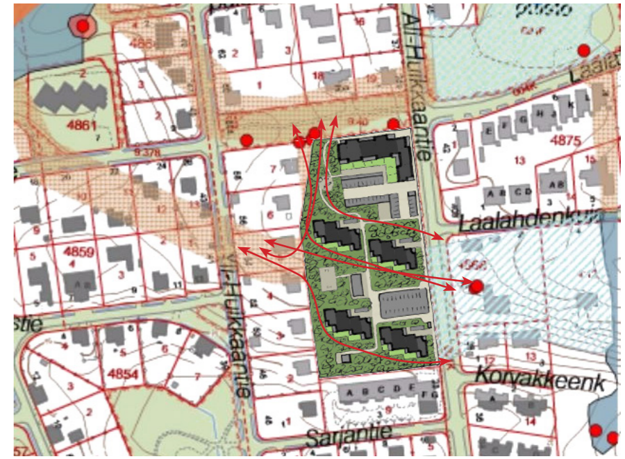
LIITO-ORAVAN VÄYLÄT, n.3000m 2

AUTOPAIKAT 1/90kem 2 : 78kpl ○8kpl. lisäpaikkaa