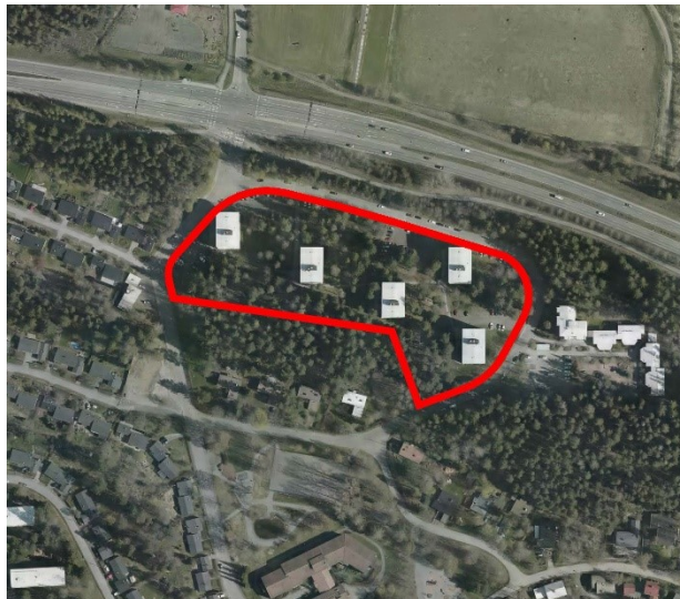
Kaava-alueen rajaus ilmakuvassa.