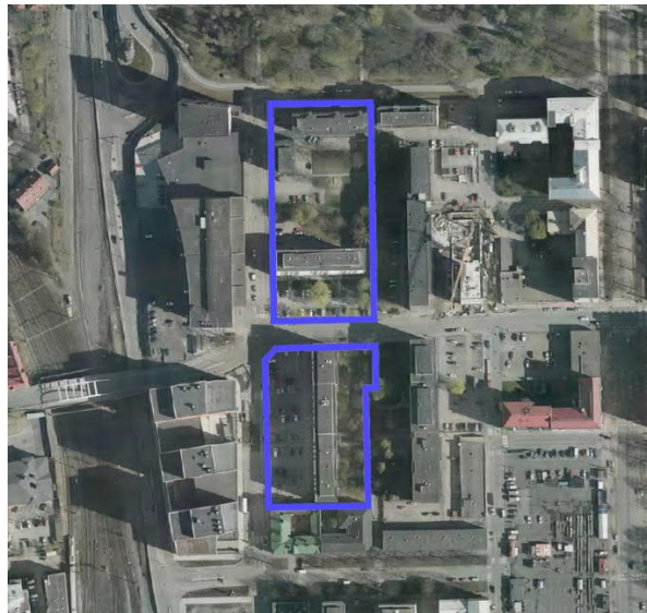
Ilmakuva alueesta