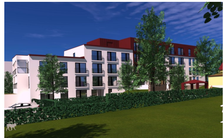
Näkymä sisäpihan puolelta