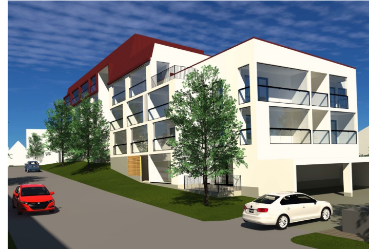
Näkymä Ollinojankadulta luoteeseen

Asuinrakennusten pääjulkisivumateriaalin tulee olla vaalea rappaus.