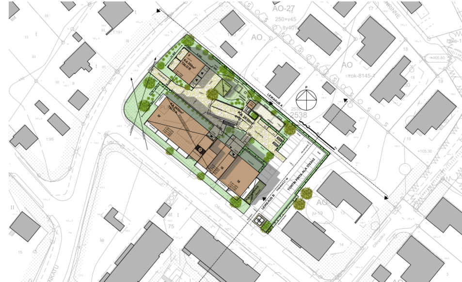
Uudisrakennukset sovitettuna ympäröivään rakennuskantaan

MÄÄRÄYS Lorem ipsum dolor sit amet, consetetur adipiscing elit, sed do eiusmod tempor incididunt ut labore et dolore magna.