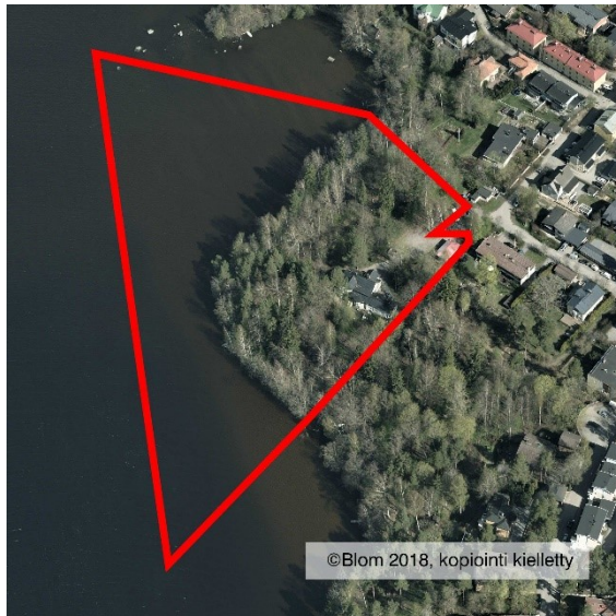
Suunnittelualueen rajaus ilmakuvassa