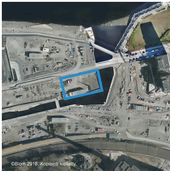
Suunnittelualan rajaus ilmakuvassa