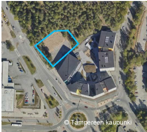
Suunnittelualan rajaus ilmakuvassa