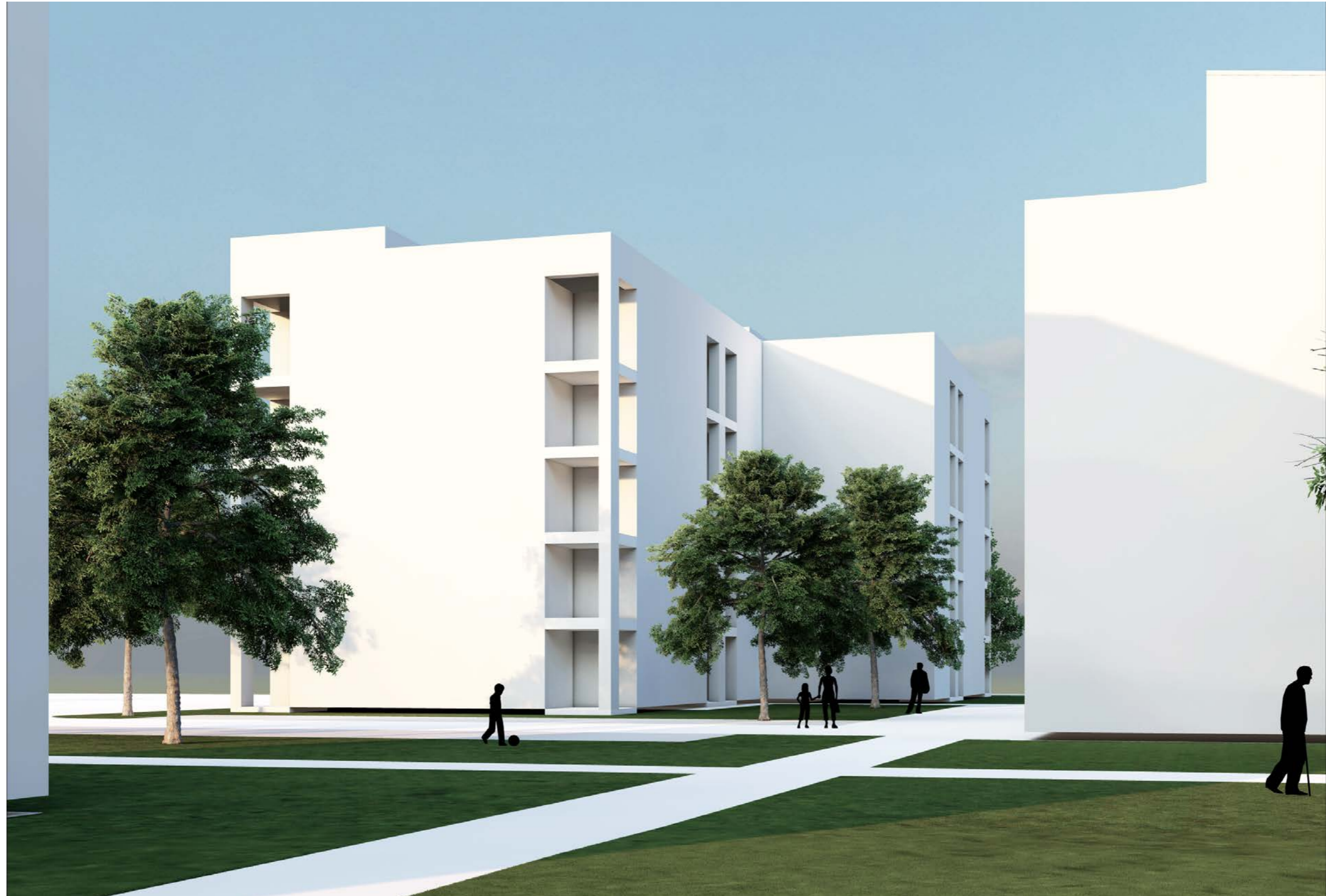
Kuva havainnollistaa rakennusmassan suhdetta vanhoihin rakennuksiin. Julkisivumateriaalit, aukotus ja kattomuodot tarkentuvat jatkosuunnittelussa.