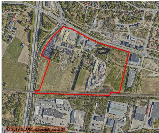
Kaava-alueen rajaus ilmakuvassa