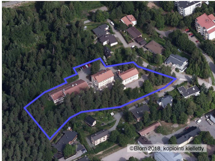
Suunnittelualan rajausta ilmakuvassa.