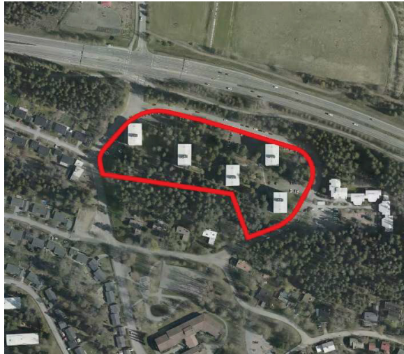
Kaava-alueen rajausta ilmakuvassa.