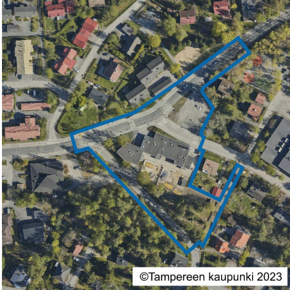
Suunnittelualan rajaus viistoilmakuvasa