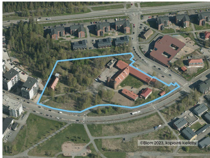
Kaavamuutosalue viistoilmakuvassa.

Kaava-alue sijaitsee Niemenrannan kaupunginosassa, noin 7 kilometriä luoteeseen kaupungin keskustasta. Suunnittelualueen muodostavat kiinteistöt 7903-7 ja 7903-8. Ne rajautuvat idässä Matilda Niemen kadun suuntaiseen pysäköintialueeseen, etelässä Federleynkatuun, länsireunaltaan osin kerrostalotonttiin ja luoteis- sekä pohjoisreunalta Tuomas Antinpojan puistoon. Kaava-alueen maasto on pohjoisreunastaan noin 10 metriä eteläreunaa korkeammalla. Kaava-alueen pinta-ala on 20 488 neliometriä. Alueella sijaitsevat Niemen kartanon pihapiiri: päärakennus, vieraspytinki ja kellari 1800-luvulta sekä navetta- / tallirakennus ja Niemen mylly 1900-luvun alkupuolelta. Kaava-alueen lähiympäristö on raitiotien myötä tiivistyvää lähipalveluiden ja kerrostalovaltaisen asumisen aluetta, joka sijaitsee aivan Niemenrannan puisto- ja viheralueiden tuntumassa.