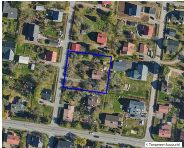
Suunnittelualue ilmakuva. Tontin rakennukset on purettu vuonna 2023.