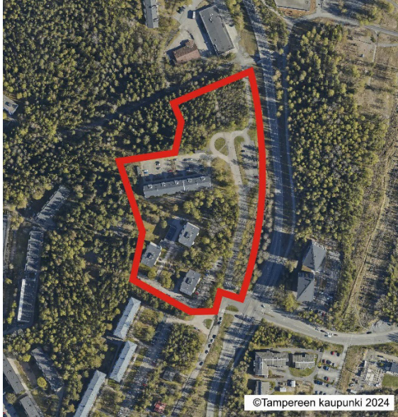
Suunnittelualan rajausta ilmakuvassa