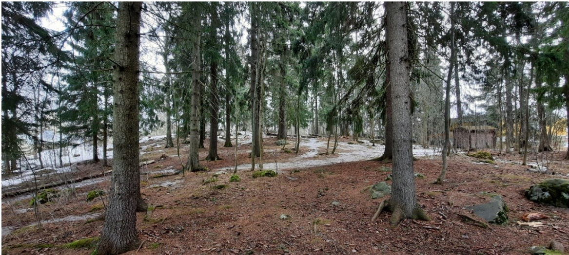
Kuva 3 Kukkolankadun koillispuoleista liito-oravalle hyvin soveltuvaa metsää.