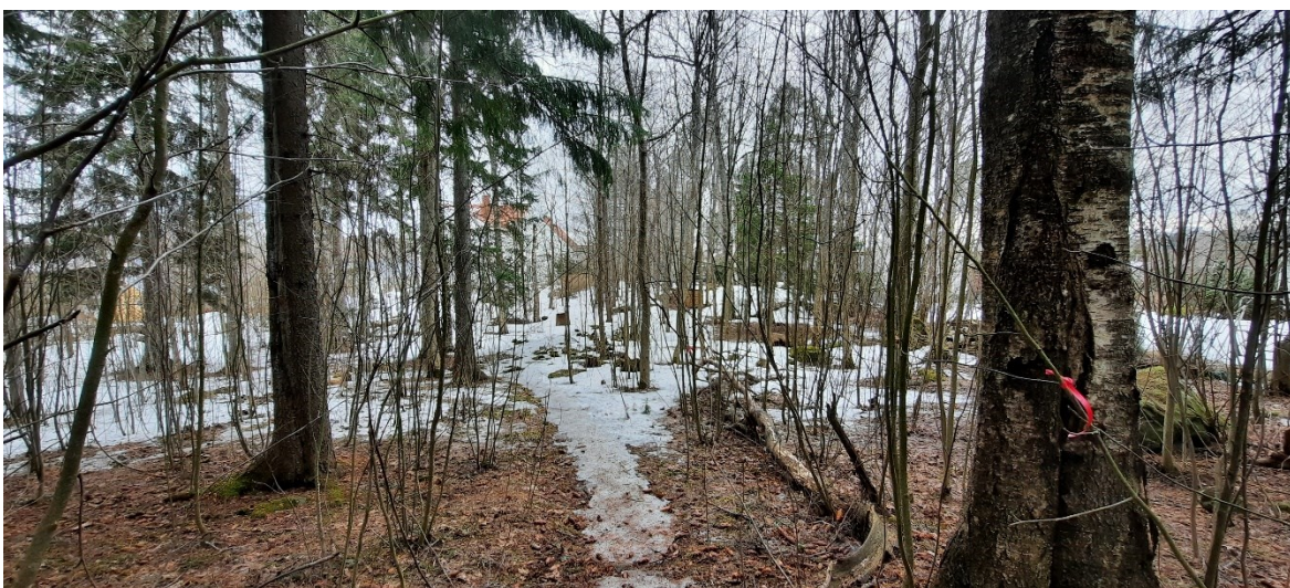
Kuva 4 Kukkolankadun koillispuolen metsän lehtipuuvaltaisempi osa alueen kaakkoiskulmassa.