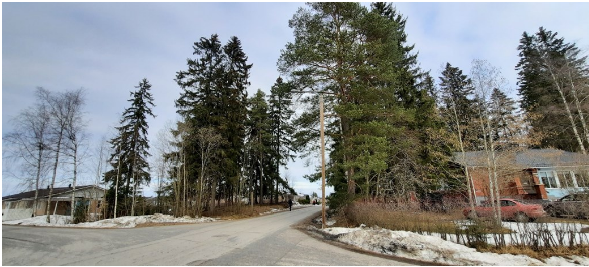
Kuva 2 Kukkolankadun selvitysalueet kuvattuna koilliseen Kukkolankadun ja Ritalankadun kulmasta.