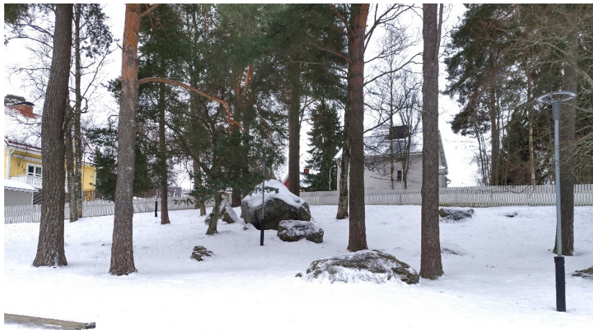
Päiväkodin pihana käytetyllä alueella kasvaa kookkaita mäntyjä.