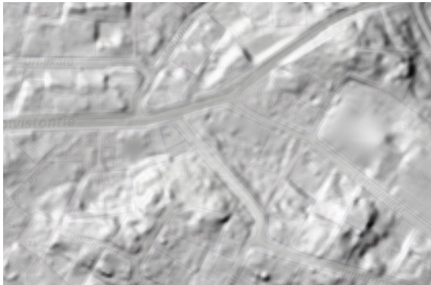
Ote korkeusmallista. Suunnittelualueen korkein kohta on Piilinkadulla. Maasto laskee kohti pohjoista.