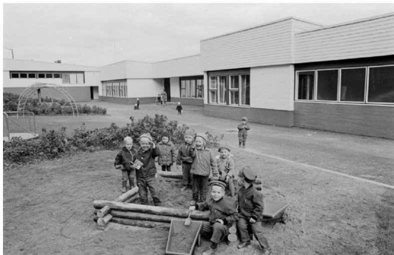
Vastavalmistunut päiväkotinäköalapaikka.

Rakennuksen tarkempi kuvaus on tehty rakennushistoriaselvityksessä ”Koivistonkylän päiväkotinäköalapaikka”.