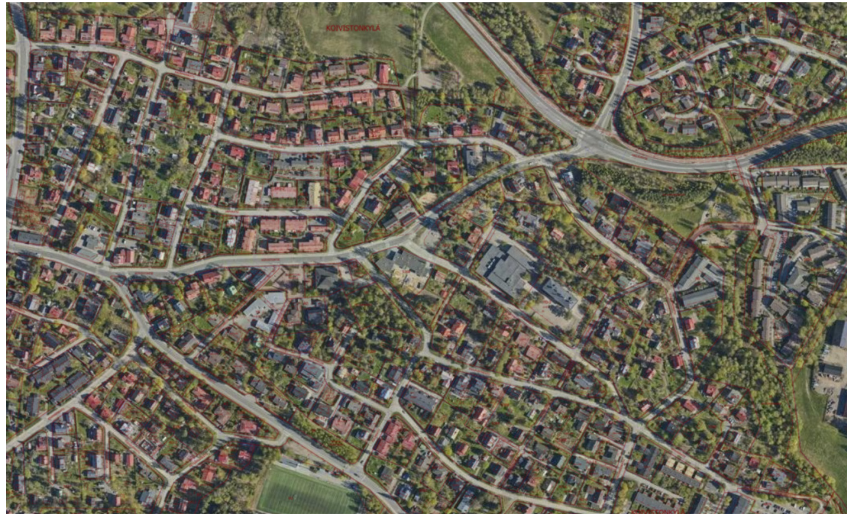
Kuva 1: Päiväkoti sijaitsee pientalovaltaisella alueella Koiviston koulun vieressä.