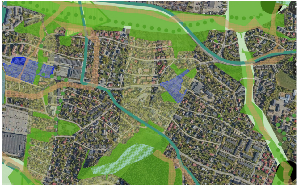
Vaiheyleiskaavan 2021-2025 luonnoksessa ekologinen yhteys on esitetty voimassa olevaa yleiskaavaa idemmäs.