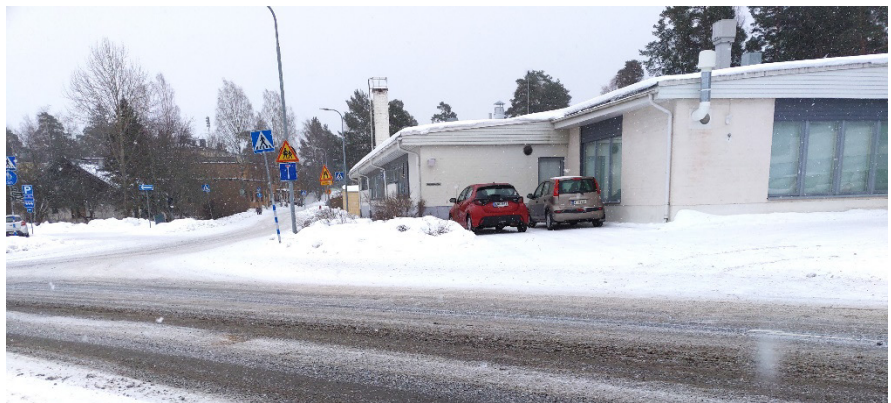
Päiväkoti Koivistontien ja Lehvänkadun kulmauksesta kuvattuna.

Suunnittelualue sijaitsee Koivistonkylän kaupunginosassa noin 3 km keskustasta kaakkoon. Alueeseen kuuluu Koivistonkylän päiväkodin tontti 5368-1, sen piha-alueena käytetty rakentamaton omakotitontti 5368-3 sekä osa Piilinkatua, Lehvänkatua ja Koivistontietä, josta mukana on myös päiväkodin pysäköintialue. Lisäksi alueeseen kuuluu kapea puistokaistale päiväkodin itäpuolelta. Alue on laajuudeltaan noin 1 ha.