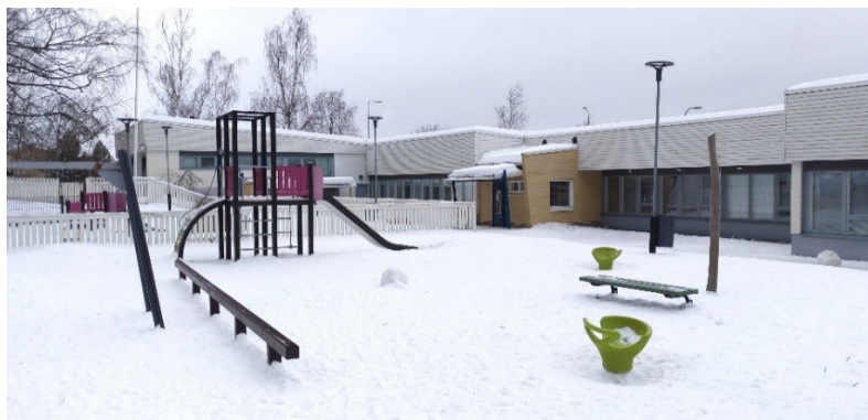
Päiväkotinäköalapaikka helmikuussa 2024.