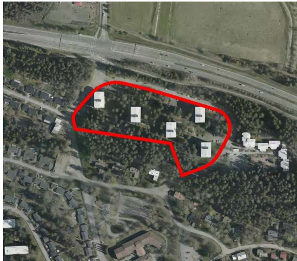
Kaava-alueen rajausta ilmakuvassa.