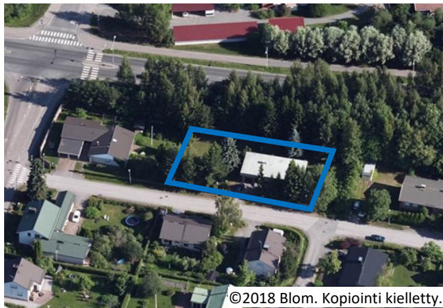
Kopiointi kielletty.