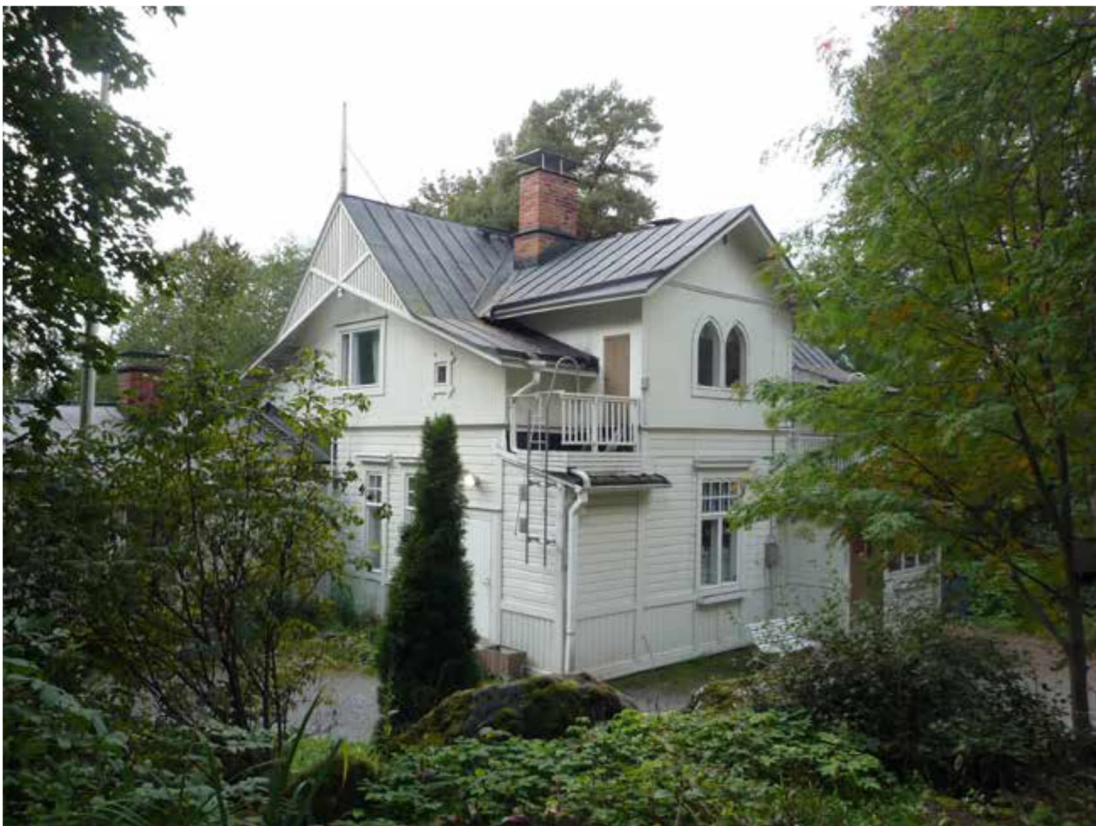
Näkymä huvilalle idän suunnasta