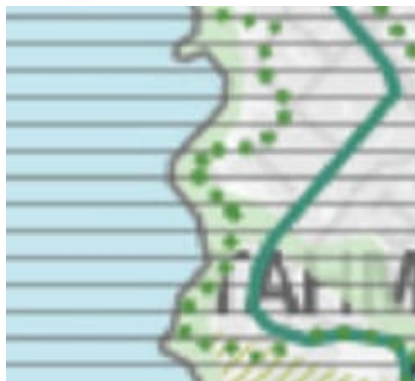
Kuva 4. Ote kantakaupungin yleiskaavayhdistelmästä. Kartta 2, viherympäristö ja vapaa-ajan palvelut.