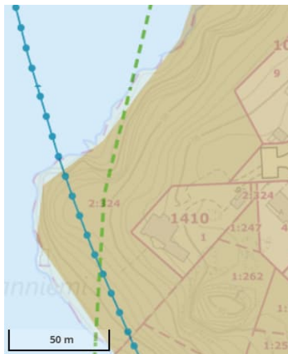
Kuva 2. Ote maakuntakaavasta 2040

https://tieto.pirkanmaa.fi/data/MKK2040/kaavamerkinnot.pdf#page=21