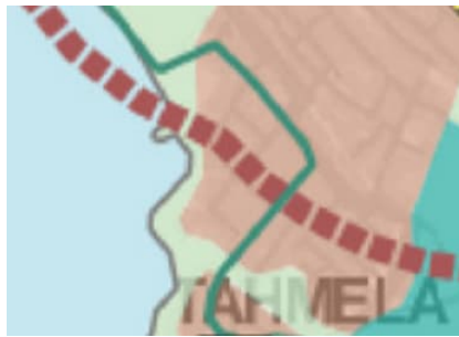
Kuva 3. Ote kantakaupungin yleiskaavayhdistelmästä. Kartta 1, yhdyskuntarakenne.