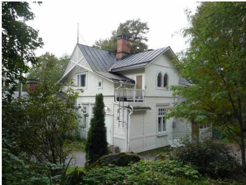
Kuva 1. Näkymä huvilalle idän suunnasta.