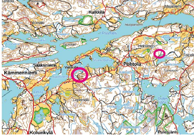
Suunnittelualueen sijainti Teiskossa