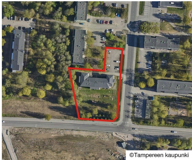
Viistoilmakuva suunnittelualueesta