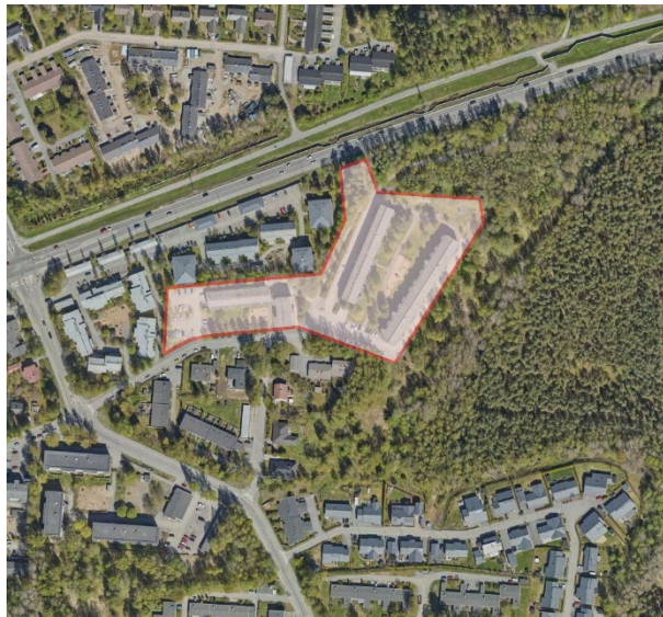
Suunnittelualueen rajaus ilmakuvassa.