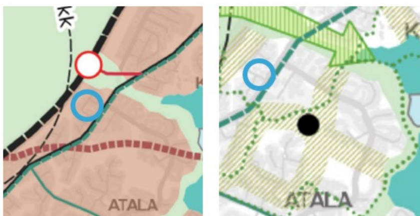
Kuva 5. Ote kantakaupungin yleiskaavayhdistelmästä. Vasemmalla kartta 1, yhdyskuntarakenne. Oikealla kartta 2, viherympäristö ja vapaa-ajan palvelut

Alue on Näsijärven valuma-aluetta sekä melu- ja ilmanlaatuselvitystarpeen harkinta-aluetta.