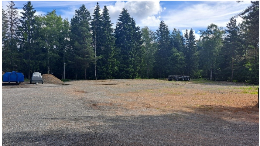
Kuva 2. Tontti on rakentamaton.