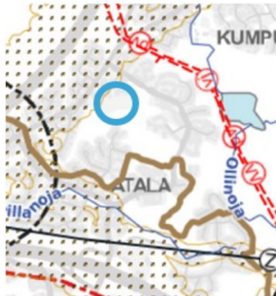
Kuva 6. Ote kantakaupungin yleiskaavayhdistelmästä. Kartta 4, kestävä vesitalous, ympäristöterveys ja yhdyskuntatekninen huolto