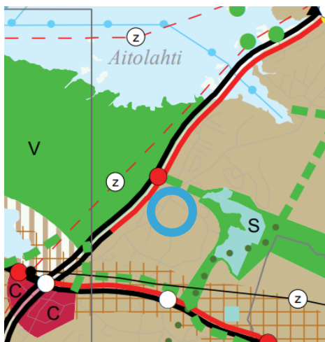
Kuva 4. Ote maakuntakaavasta 2040