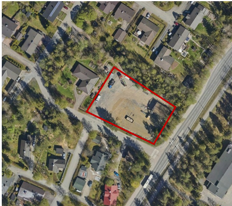
Kuva 4. Ilmakuva suunnittelualueesta vuodelta 2022. Tontti on tällä hetkellä rakentamaton.

Aitolahdentien toisella puolella sijaitsee Atalan liikekeskus ja alakoulu sekä päiväkot. Koilliskeskukseen on matkaa noin 2 km.