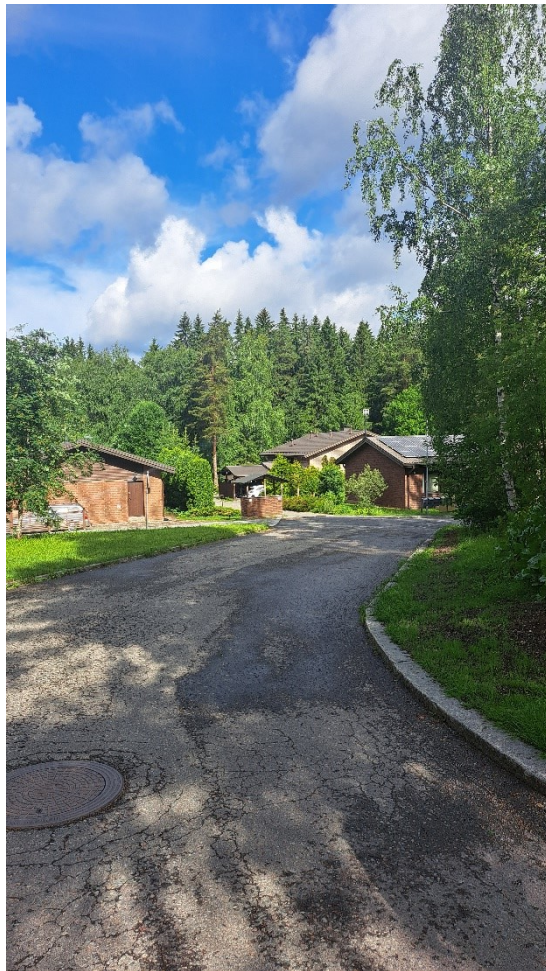
Kuva 3. Lähialueen rakennuskantaa