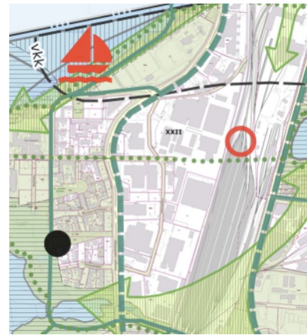
Kuva 3: Ote Kantakaupungin yleiskaava 2040 ja vaiheyleiskaava valtuustokausi 2017–2021, viherympäristö ja vapaa-ajan palvelut