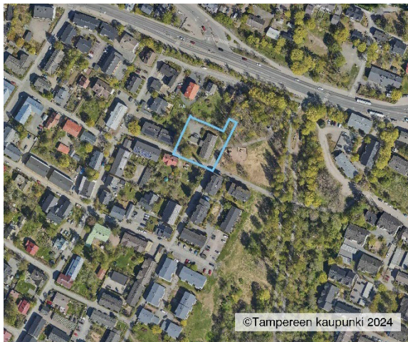
Kaavamuutosalue ilmakuvassa. Kuvassa tontilla näkyy jo purettu entinen neuvolarakennus.