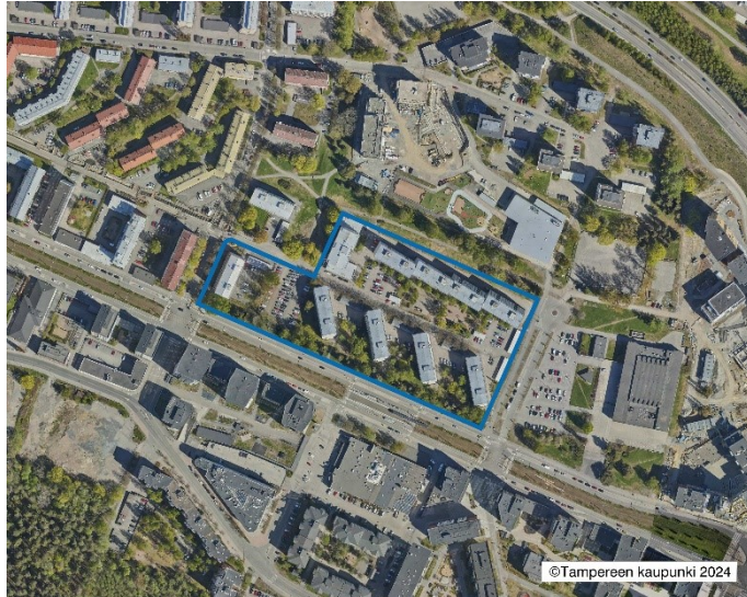
Suunnittelualan rajaus ilmakuvassa.