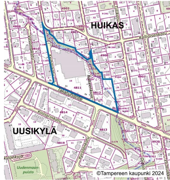
Suunnittelualan rajausta virastokartalla.