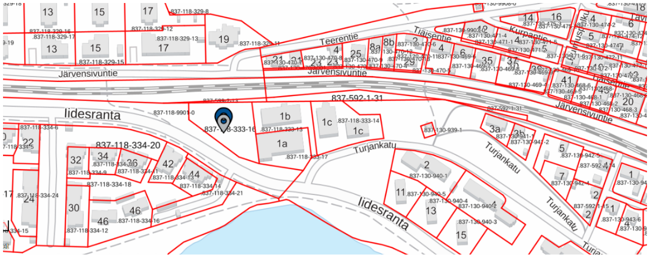
Kuva 1. Puhdistettavan alueen sijaintikartta.