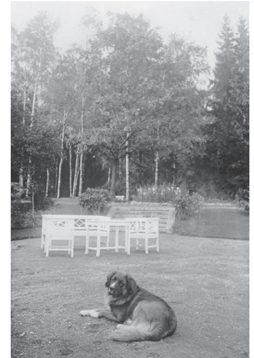
Kuva kartanopuiston näköalatasanteelta pohjoiseen vuodelta 1925.