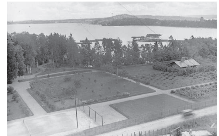
Kuva kartanon hyötytarhasta 1920-1930-luvulta.