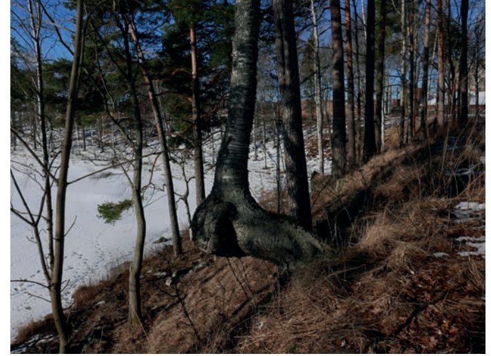
Nykyisessä Hiedanrannan rantavyöhykkeessä on voimakkaita korkeuseroja. Jyrkin rinne, noin viiden metrin tasoerolla, sijaitsee kartanopuiston näköalapaikan kohdalla.