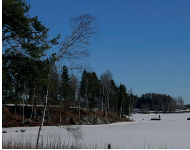
Kartanopuisto työntyy kallioisena ja puustoisena niemenä Näsijärveen. Taustalla hahmottuvat kartanon vanhat laiturirakenteet vedessä sekä Niemenrannan osayleiskaavassa viheralueeksi osoitettu Niemenrannan täyttömäki.

Muita kilpailualueen ulkopuolella sijaitsevia kaikille avoimia leikkipaikkoja sijaitsee suunnittelualueen rajalla Niemenrannassa, Lentävänniemessä, Lielahdessa sekä Ala-Pispalassa. Santalahden rantapuistoon suunnittelualueen itärajalla sijoittuu lisäksi rullalautailu- ja bmx-alue sekä koirapuisto. Hiedanrantaa lähimpiä pelikenttiä Sellupuiston lisäksi sijoittuu Lentävänniemeen, Epilään ja Ala-Pispalaan. Lisäksi suunnittelualueen länsirajalle sijoittuu koulujen liikuntakenttiä. Uimarantoja ja -paikkoja ei sijaitse Hiedanrannan puoleisella lahdenpoukamalla. Hiedanrantaa lähimmät uimapaikat sijaitsevat Lentävänniemessä ja Ryydynpohjassa.