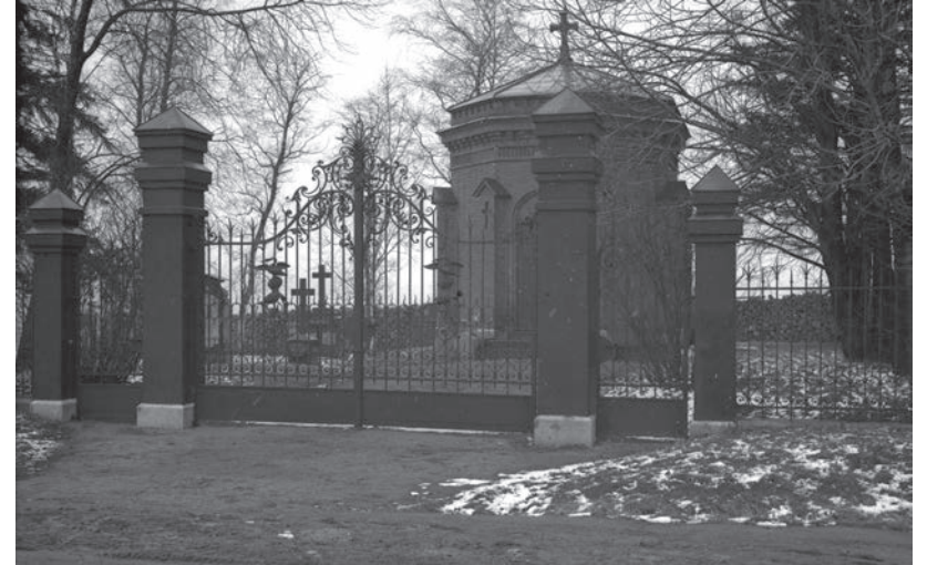
Nottbeekin hautausmaa ja kappeli sekä aluetta ympäröivä koristeellinen aita.