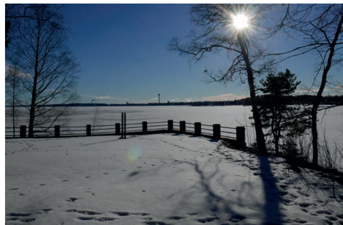
Kartanopuiston näköalapaikalta aukeaa laaja vesistönäkymä kaupunkiin ja Pyynikinharjulle päin.