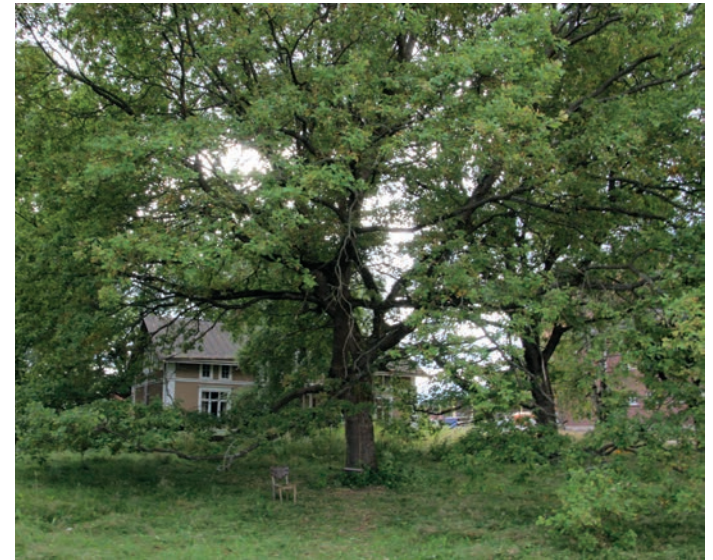
Suunnittelualueella on komeaa, vanhaa puustoa mm. kartanopuistossa, Nottbeckin hautausmaalla sekä vanhalla kylätontilla tehdasalueen länsipuolella.