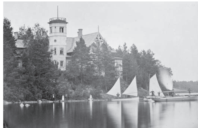
Lähellä rantaa sijainnut huvila ennen päärakennuksen rakentamista.