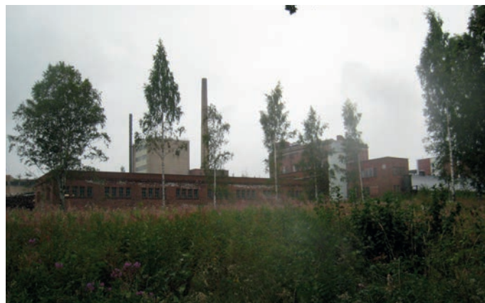
Teollisuusympäristö sekä toimivat että käytöstä poistetut tehdasrakennukset piippuineen hallitsevat Hiedanrannan maisemakuvaa.

Alueen sisällä tehtaan piiput ja julkisivut hallitsevat maisemaa sekä etelästä että pohjoisen suunnasta katsottuna, mutta teollisuusympäristön pääjulkisivu on etelään. Näkymä Nottbeckin hautakappelilta kartanon tornille on kulttuurihistoriallisesti merkittävä näkymälinja.