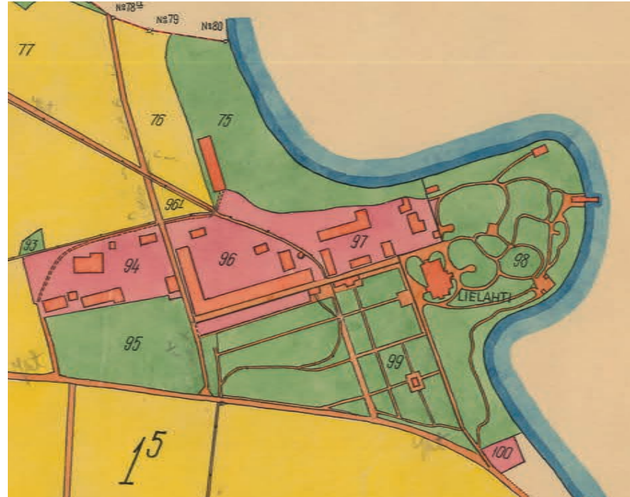
Vuoden 1910 kartasta erottuu kartanon maisematyylinen puisto ja laaja hyötytarha.

Kartanopuiston lisäksi alueen arvokkaimpiin puutarhataiteellisiin piirteisiin kuuluu Nottbeckien hautausmaa. Hautausmaa ja sen keskelle toteutettu kappeli rakennettiin vuonna 1885 pellon keskellä sijainneeseen metsäsaarekkeeseen. Hautausmaa ympäröitiin koristeellisella aidalla, joka siirrettiin Lielahden Nottbeckien omistamalta Näsipuiston huvilalta. Hautausmaan aita, portti, Nottbeckien suvun hautamuistomerkit ja puusto ovat säilyneet nykypäivään. Ympäristö on sen sijaan muuttunut voimakkaasti, ja liike- ja teollisuusalue ulottuu nykyään hautausmaan rajaan asti.