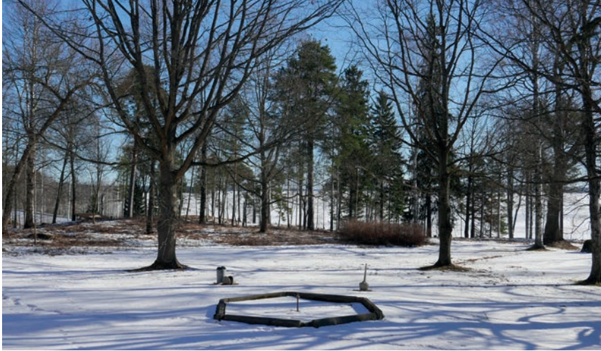
Kartanon maisemapuistosta avautuvat näkymät Näsijärvelle. Edessä suihkulähteen allas.