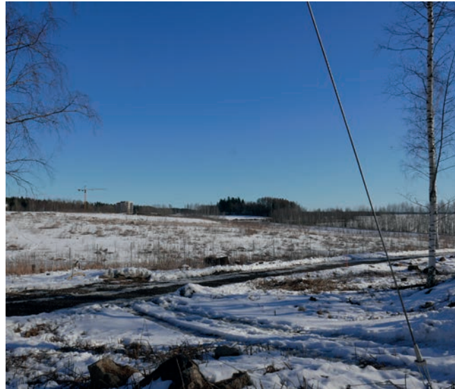
Suunnittelualueen pohjoisosassa sijaitsee Niemenrannan ja Hiedanrannan kaupunginosien päävirkistysalueeksi rakentuva Sellupuisto, joka on suurelta osin läjityksien muokkaamaa maisemaa. Sellupuiston täyttömäki nousee vielä toistakymmentä metriä ylöspäin.