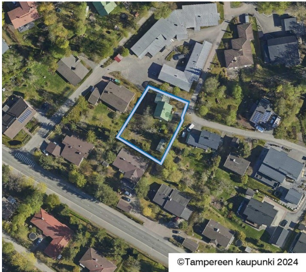
Suunnittelualan rajausta ilmakuvassa