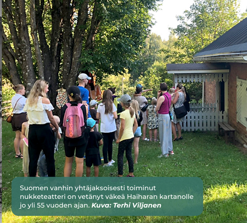
Suomen vanhin yhtäjaksoisesti toiminut nukketeatteri on vetänyt väkeä Haiharan kartanolle jo yli 55 vuoden ajan.

osaohjelmassa. Kehittämisen taustalla ovat asukkaiden ja toimijoiden toiveet Haiharasta vielä nykyistään kirkkaampana, ympärivuotisena alueen helmenä ja yhteisöllisenä keskuksena.