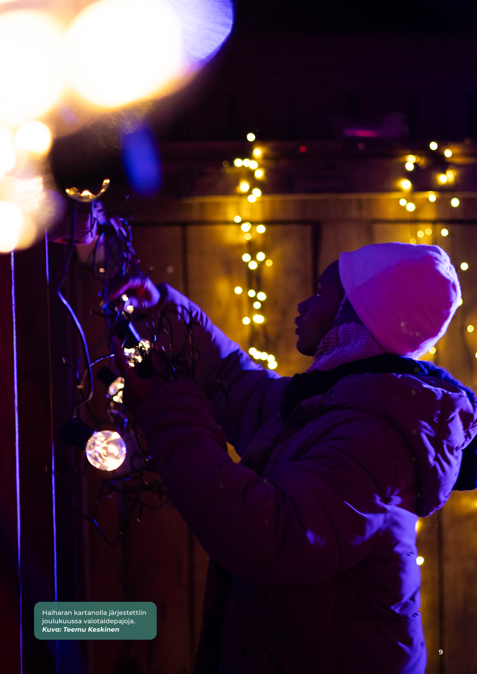
Haiharan kartanolla järjestettiin jouluukuussa valotaidepajoja.