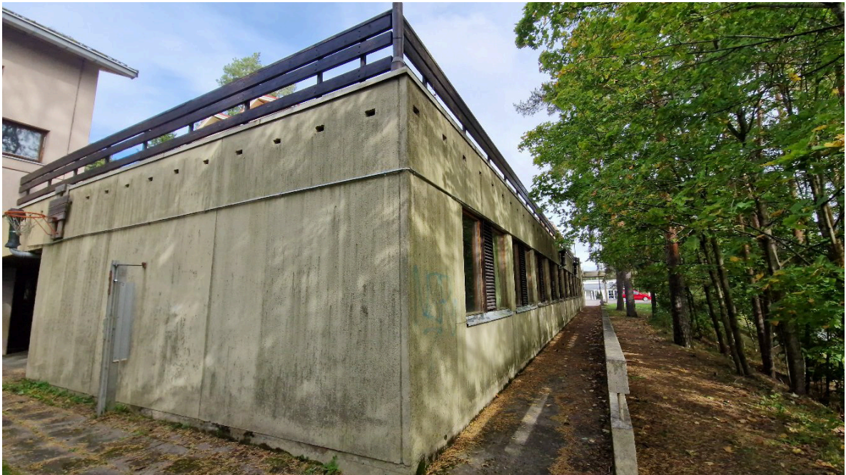
Kuva 5. Toimintakeskus kytkeytyy vanhaan rakennukseen alatasen betonirakenteisena rakennuksena, jonka katto toimi ulkoterassina.