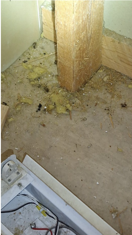
Kuva 8. Ullakkotilan itäpäässä eristevillojen päällä on vanerilattia. Nurkassa oli oravan yksittäisiä jätöksiä.