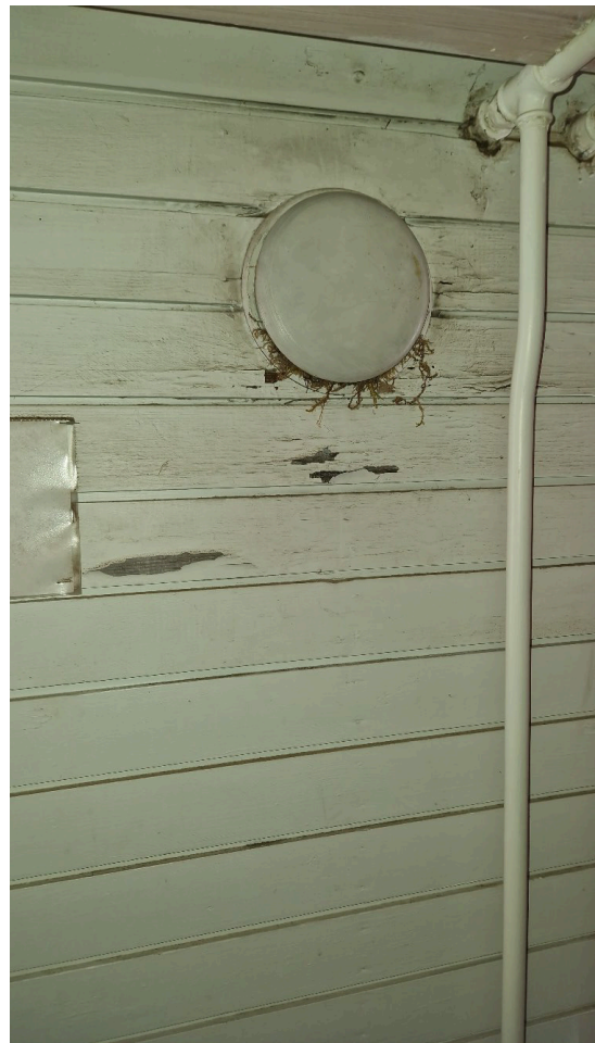
Kuva 7. Ullakkotilassa eristevilla on osittain paljaana, osin lattia on betonia. Villat olivat puhtaat. Sisätiloissa on ilmanvaihtohormit. Yhdessä suorassa ilmanvaihtoaukossa on pesinyt lintu.