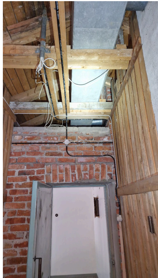
Kuva 2. Asuntolan ullakkotilat ovat lämmittämättömiä. Rakenteet olivat puhtaita eikä eläinten jätöksiä esiinny lainkaan.