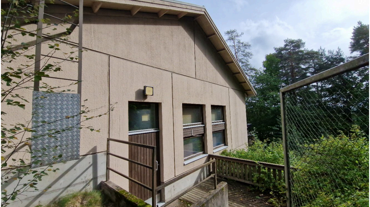
Kuva 4. Toimintakeskuksen rakennus on elementtirakenteinen.

kirkkosalirakennukseen. Alakerrassa on mm. saunatilat ja uima-allas sekä muita huonetiloja. Yläkerrassa on huonetiloja. Rakennuksessa on tuulettuva ullakkotila. Rakennuksen kaikki sisätilat tarkistettiin.