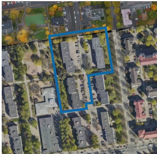
Kuva 2: Kaavamuutoksen aluerajaus ilmakuvassa.