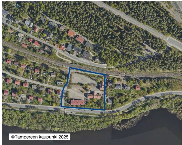
Suunnittelualan rajaus ilmakuvassa.