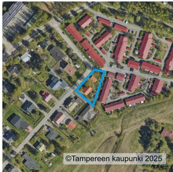
Suunnittelualueen rajausta ilmakuvassa